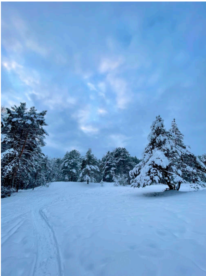
Nõmme - Mustamäe