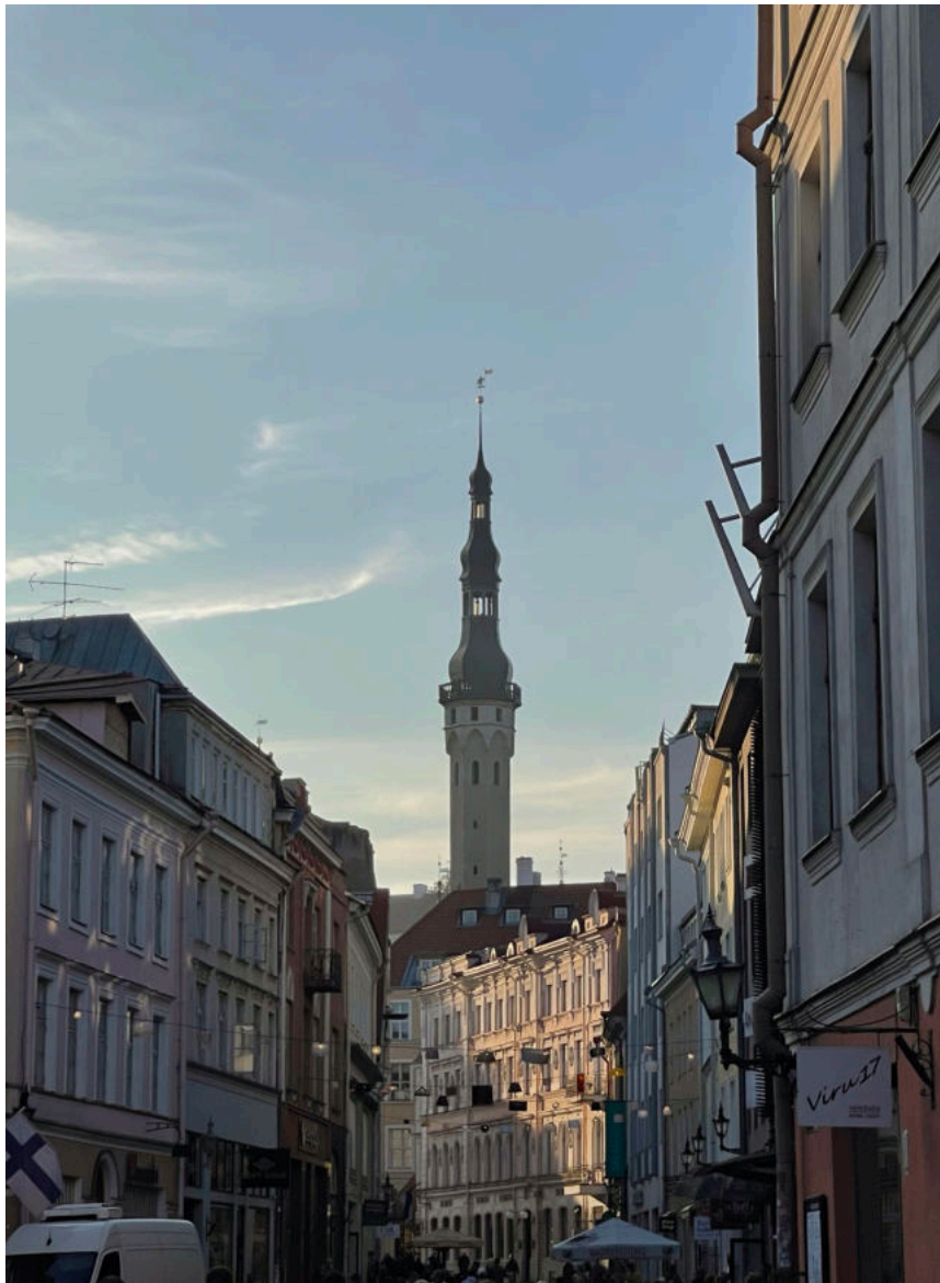
Old town Tallinn