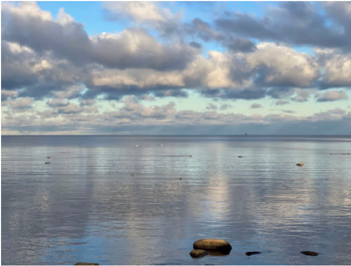
Kopli - Strand

Generell ist Tallinn und Estland ein wunderschönes Fleckchen, welches viele Möglichkeiten zum Erkunden bietet. Egal ob Natur, Architektur, Museen oder Café-Hopping, dir wird es nicht an Aktivitäten mangeln.