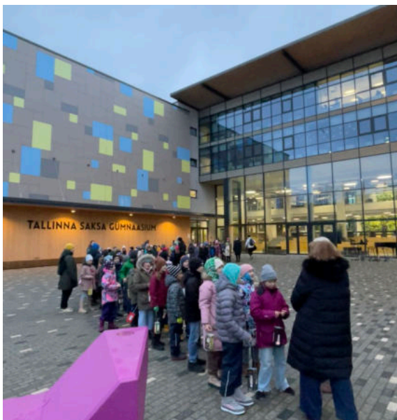
Laternen - Umzug mit den 3. Klassen