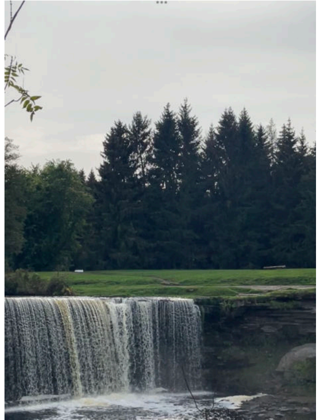
Jägala - Waterfalls