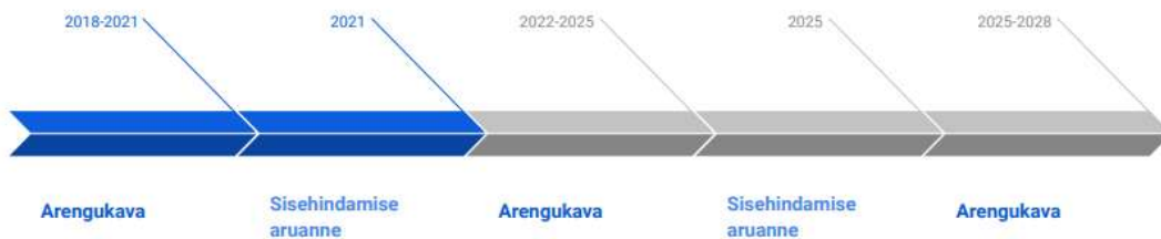
Joonis 2. Sisehindamise ja arengukava aruannete seosed.

3.1 Õppeasutus koostab sisehindamise aruande vähemalt üks kord kooli arengukava perioodi jooksul (Joonis 2).